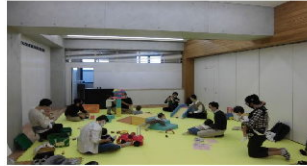
★ 昨年度の実施風景 ★