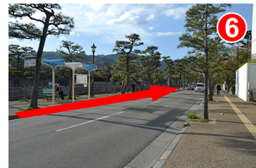
途中阪急バスのバス停がありますがそのまま通り過ぎます。