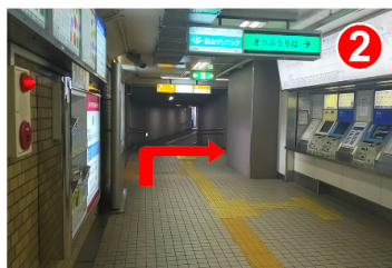
券売機を通り過ぎてすぐに右（南出口方面）に曲がります。