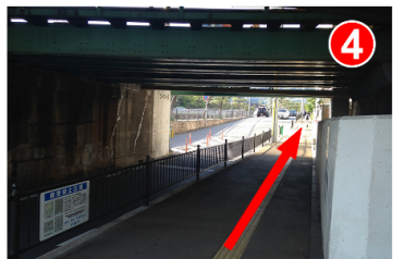
右に曲がると高架下になっています。そのまま通り抜けます。