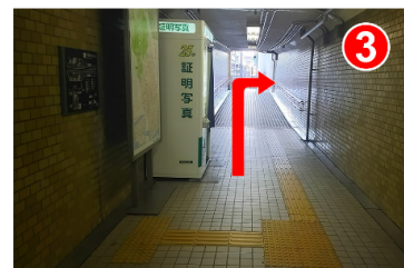
突き当たりを右に曲がります。