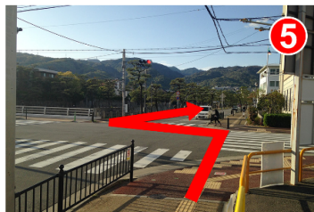
高架を抜けてすぐに信号があります。道路の左側道に渡ります。