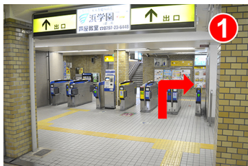
東改札口をでて右（南出口方面）に曲がります。