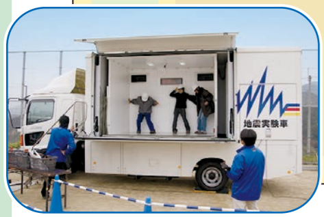
起震車体験の様子

今後 30 年以内に起きる確率が 70% ... 「南海トラフ地震」を体感して地震に備えよう! ※乗車人数に限りがありますので、ご了承ください。