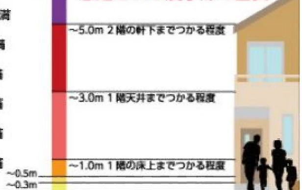
『芦屋市防災情報マップ』